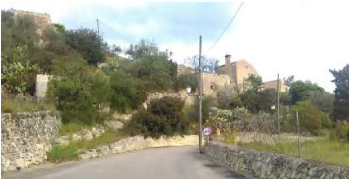
IMATGE 3. Desnivell des del comellar des Rafal a les cases de Can Miquel Puput i Can Sant.

Pel que fa a la centralitat del nucli, aquesta està conformada per l'aglomeració d'edificacions residencials, ja que, més enllà de l'espai dedicat a camins i carrers, el nucli de Ses Coves no compta amb espais públics, tals com places o parcs. Els elements de patrimoni construït que configura Ses Coves contribueixen notablement a dotar d'estructura i d'essència al lloc i la seva especificitat. En aquest sentit, més enllà del valor patrimonial de les edificacions, també donen equilibri paisatgístic els vells traçats dels camins, els murs de paret seca que defineixen la secció d'aquests o tota l'estructura hidrogràfica.