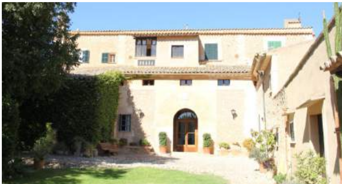
IMATGE 7. Façana principal de la possessió de Sa Torre, documentada des del s. XVI.

Finalment, cal assenyalar que la consolidació de ses Alqueries com a nucli urbà des de les etapes medievals, així com del seu us continuat com a tal fins a l'actualitat, permet concebre la pervivència de restes arqueològiques en aquest conjunt.