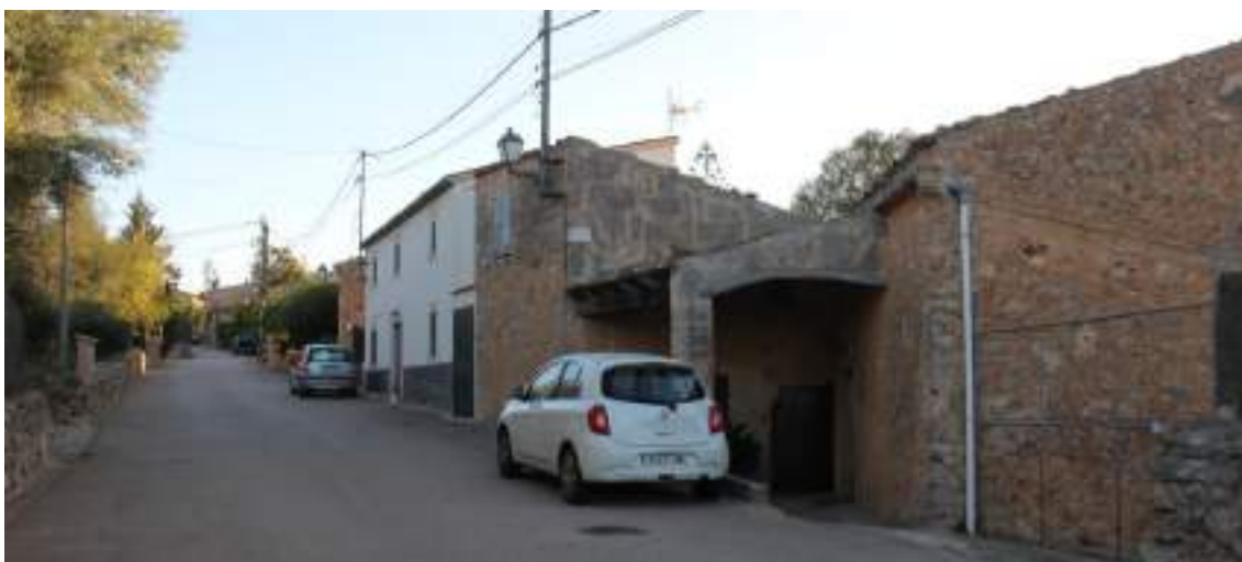
IMATGE 5. Vista del camí de Ses Ollerries on s'observa la homogeneïtat del teixit construït.

El relleu, per tant, va determinar des del seu origen la trama urbana del llogaret. A diferència d'altres nuclis rurals de petites dimensions, Ses Coves presenta una disposició allargada seguint el traçat del camí homònim que uneix la vila de Santa Eugènia amb la carretera Palma-Sineu. Aquest eix principal travessa tot el nucli, amb construccions generalment disperses. No obstant, en alguns trams del camí, les cases vilatanes tradicionals comparteixen mitgera o estan situades més a prop unes de les altres, sense arribar a estar completament agrupades. La resta de carrers, de forma general, discorren perpendiculars al carrer principal per a donar accés als habitatges situats a la part més elevada del nucli. El camí de Son Tano, en canvi, té un traçat més llarg i canvia de direcció per tal de donar accés a alguns dels carrers perpendiculars.