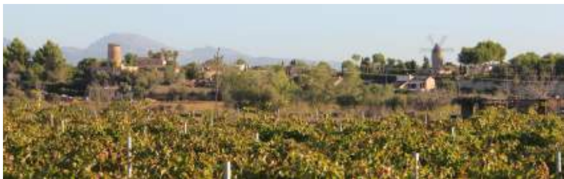
IMATGE 6. Vista panoràmica del nucli de Ses Alqueries.

El nucli de Ses Alqueries es localitza a la part nord-oriental del municipi de Santa Eugènia, a la part meridional del Raiguer, travessat pel torrent de Solleric i la síquia de son Mascaró. A diferència dels altres dos llogarets de Santa Eugènia, Ses Alqueries se situa en una plana agrària on hi predominen els cultius de vinya i de cereals. L'assentament, però, es troba lleugerament elevat respecte els camps de cultiu, la qual cosa ofereix visuals interessants dels conjunt des de diferents punts del seu entorn.