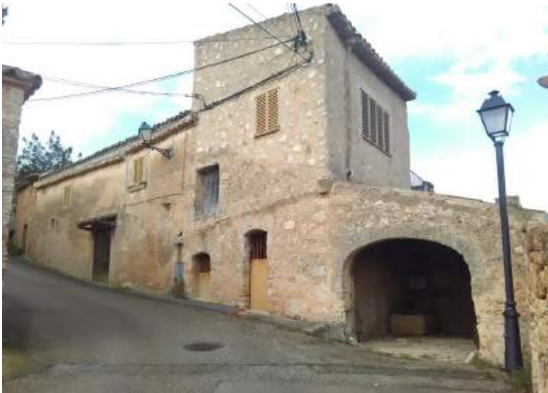
IMATGE 4. Cas Gorrió exemplifica el tipus de construcció de Ses Coves, amb tancaments de maçoneria ordinària de la pedra calcària irregular del lloc.

dels promotors, o, més darrerament les modes, aquesta maçoneria es presenta o bé amb revestiments continus, a vegades amb morters amb incrustació de petits còdols per evitar retraccions d'aquests, estesos bé de forma regular bé de forma més decorativa, o bé amb revestiments parcials, que només recobreixen les juntes de forma generosa, o bé sense revestiment.