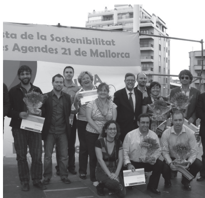
Fotografia de l'entrega del premi al municipi de Santa Eugènia per la gran participació ciutadana del seu procés de l'Agenda Local 21 durant la II Edició de la Festa de la Sostenibilitat.